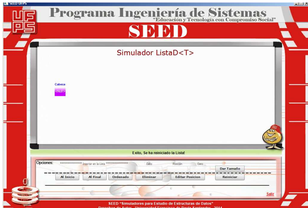
“Reinicio de la Lista Doble”.

Para reiniciar la Lista Doble, el estudiante deberá dar clic en el botón “Reiniciar”, esta acción elimina todos los datos de la Lista Doble dejándola vacía para que el estudiante comience a ilustrar de nuevo las funciones básicas de la estructura.