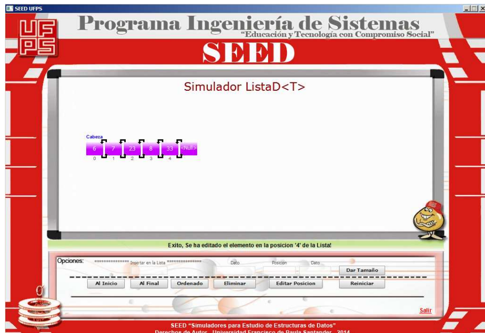
"Lista Doble después de editar la posición '4' con el dato: "33"