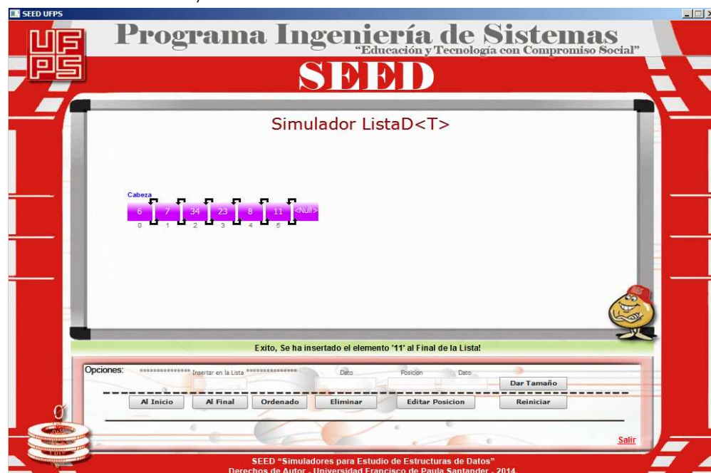
“Lista Doble después de insertar los datos: 6, 7, 34, 23, 8 y 11”.

Se debe ingresar el valor del dato a insertar en la Lista Doble, el cual no puede ser menor a -99 ni mayor a 999 , rango seleccionado por cuestiones de que no se desborde el número del nodo gráfico. Una vez insertado el dato, este será mostrado a continuación en la Lista Doble.