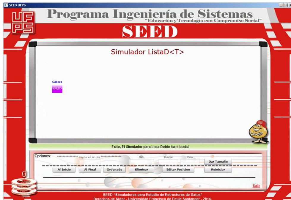
“Interface principal del Simulador para ListaD<T>”