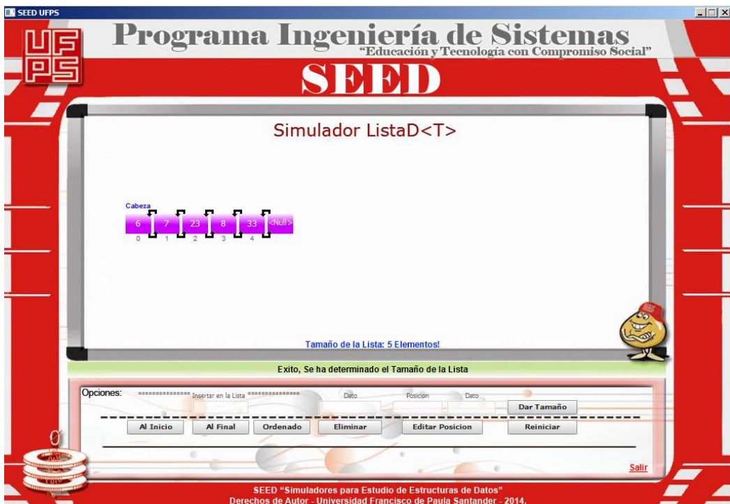
"Tamaño de la Lista Doble determinado"

Para conocer el tamaño de la Lista Doble, el estudiante podrá oprimir el botón "Dar Tamaño" dependiendo del valor de la Lista Doble que desee conocer en su momento.