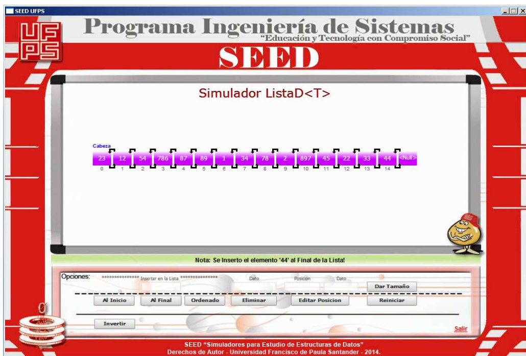
"Lista Doble original con 15 datos".

A continuación se comprueba el funcionamiento del Algoritmo realizado: